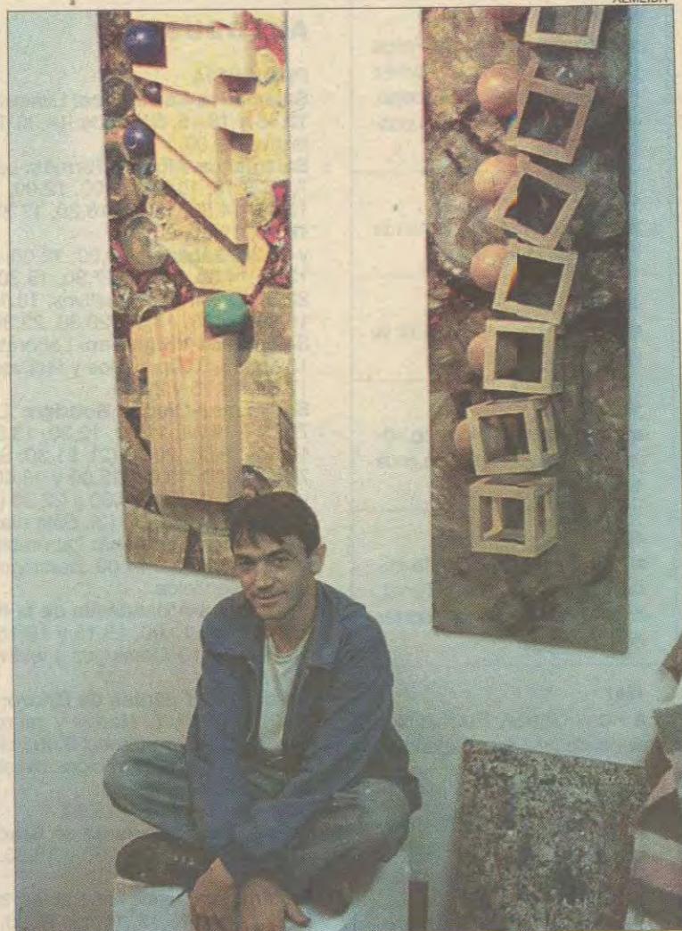
ORIGINALIDAD. La madera define la obra del artista navarro.

Su obra no hace concesiones a la belleza, sino al mensaje